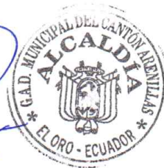
Ing. Edwin Rengel Jaramillo ALCALDE GAD MUNICIPAL DE ARENILLAS